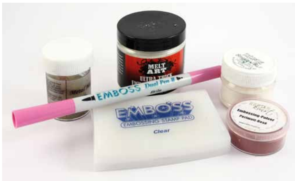
Potřebujete embosovací médium – buď v polštářku, nebo v tužce – a různé embosovací prášky.