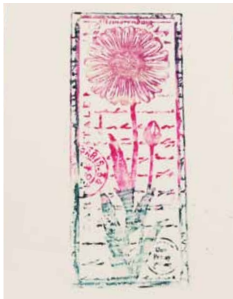
Razítko můžete pomocí embosovacího fixu přetřít různými barvami, poté zasypat průsvitným práškem a výsledkem je vícebarevný obrázek.

Pro začátek doporučuji pořídit si prášek zlatý, bílý a průsvitný – a s těmito barvami vytvoříte většinou projektů.