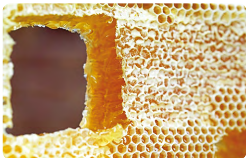
Plástev včelího vosku

Pojďme si o včelím vosku povědět něco víc. Jak už z názvu plyne, vzniká v těle některých druhů včel. Barva je podobná plážovému písku, bíložlutá, jak vidíme na obrázku.