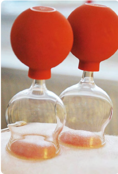
Nahřáté baňky uvolňují podkoží pomocí podtlaku

Moxování funguje na podobném principu jako akupunktura. Jedná se o léčebnou metodu tradiční čínské medicíny spočívající v nahřívání či požehování akupunkturních bodů zapáleným sušeným pelyňkem. Jelikož se jedná o metodu, kdy je doplňována energie jang, nehodí se pro osoby, které naopak trpí velkým teplem (jinem). Nejčastěji se tedy s moxováním využívá u pacientů, kteří trpí chladem. Ať už vnitřním nebo vnějším. Moxování je účinná alternativní metoda. Bohužel ve chvíli, kdy se zvolí aplikace přímo na kůži, dochází často následkům v podobě popálenin a jizviček. I z toho důvodu preferuji aplikaci svíce. Oheň nepříjde do styku s kůží.