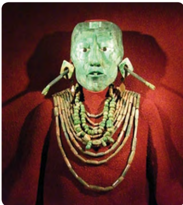
Posmrtná maska krále a použití ušních svící (Antropologické muzeum v Mexiku)