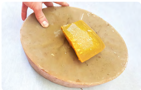
Včelí vosk je čistě přírodní surovina