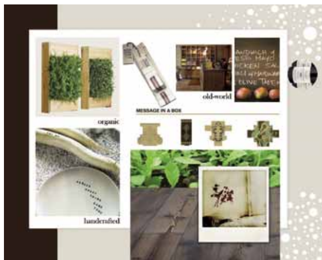
Koncept eco natural interiér.

materiál pečlivě nalepíme a vytvoříme koláž. Stejně tak můžeme vytvářet svůj koncept na počítači, např. pomocí Photoshopu.