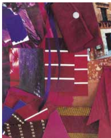
Spolu s konceptem si vytváříme i nástěnku plnou vzorků látek, tapet, barev, myšlenek, skic, fotografií...