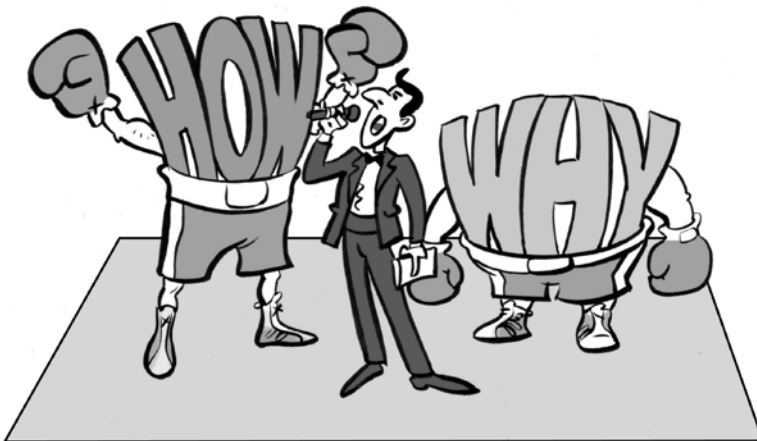
HOW – JAK, WHY – PROC

A v modrém rohu už se chystá štíhlý borec o váze šedesát tři a půl kilogramu, hrdina naděje, šampion rozhovorů, tajemství řešení. Je rychlý, je nepředvídatelný (a rád si trošku zalaškuje). Prosím potlesk pro našeho borce – „JAK“.