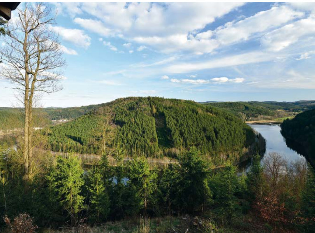
Jungmannův altán, výhled na vodní nádrž Březová