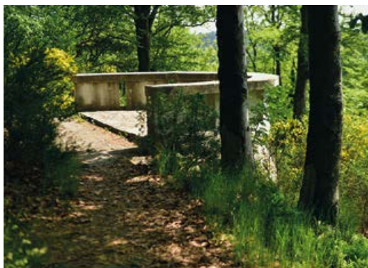
Plošina vyhlídky Ottova výšina

Hanoje nebo řecké Soluně. V letech 1910–1912 tak podle jeho návrhu a pod jeho vedením vznikla na vyvýšíně Helenin dvůr nová dominanta Karlových Varů. Do provozu byl hotel uveden 18. června 1912 a rychle se stal světově proslulým. V době vzniku hotelu dosáhly Karlovy Vary největší návštěvnosti ve své lázeňské historii, která ročně čítala na 70 tisíc hostů. Především hosté z Anglie a zámoří s sebou přivezli nový druh zábavy a životního stylu, které se promítly do výstavby tenisových kurtů, golfových hřišť a dostihové dráhy. První světová válka, rostoucí atraktivita mořských lázní (hlavně Riviéry) a po válce alpských středisek příliv lázeňských hostů zastavily. Kolaps karlovarského lázeňství pak způsobily hospodářská krize a především druhá světová válka, na jejímž konci se přijelo léčit pouhých 3 794 hostů. Další ranou pro lázeňství bylo následující znárodnění léčivých minerálních zdrojů a lázeňských zařízení. Desetiletí trvající státní monopol skončil rokem 1990, který znamenal nástup akciových společností a soukromých majitelů. Původní lesk hotelu navrátila a novou kapitolu v jeho historii otevřela v roce 1992 akciová společnost Imperial Karlovy Vary, jež v roce 2003 ukončila generální rekonstrukci tohoto hotelového skvostu.