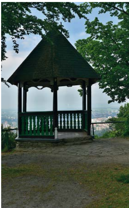
Část plošiny vyhlídky Camera obscura s altánkem