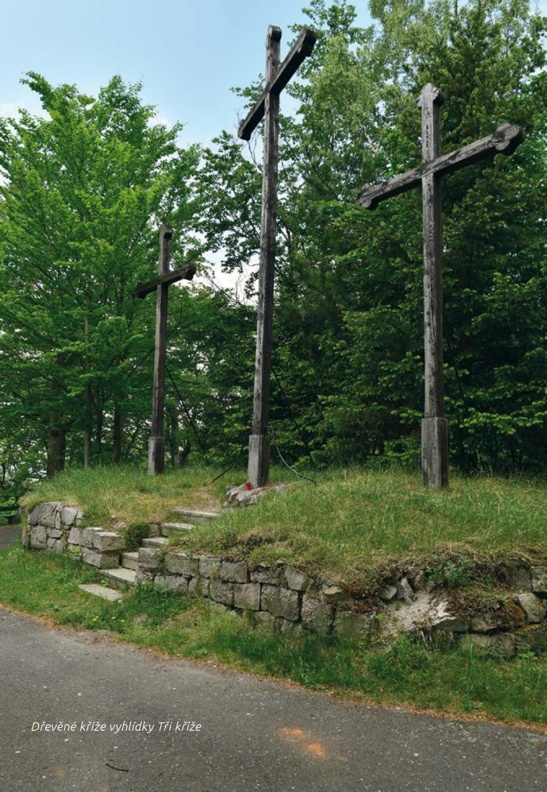
Dřevěné kříže vyhlídky Tři kříže