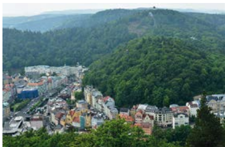
Vyhliídka Tři kříže – Teplá, Vřídlo, Grandhotel Pupp, Výšina přátelství a rozhledna Diana