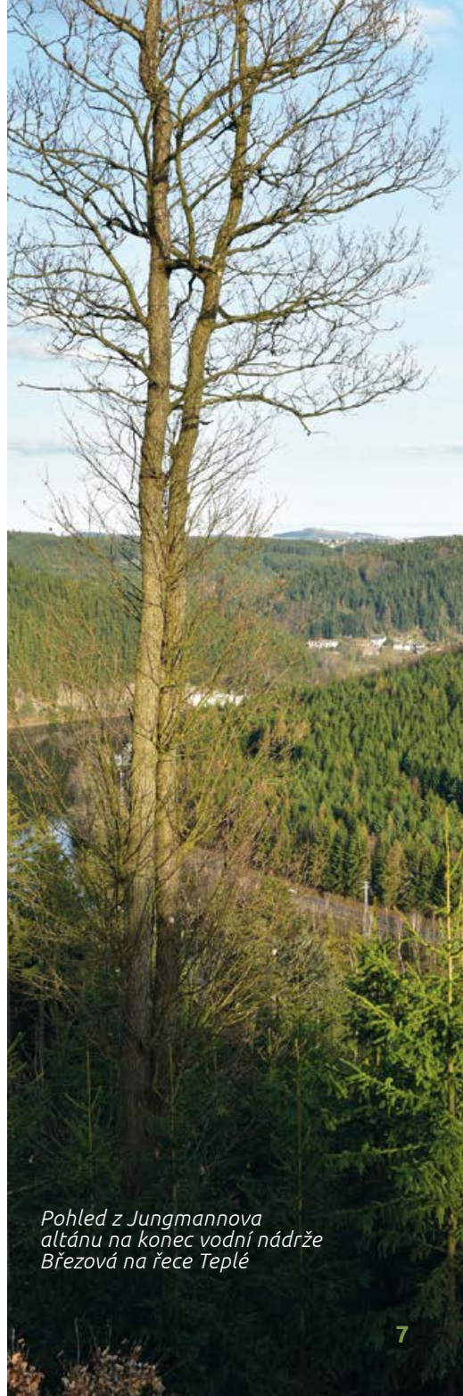
Pohled z Jungmannova altánu na konec vodní nádrže Březová na řece Teplé

A nyní již nezbyvá než dotankovat nádrž, koupit si jízdenku, kromě trochy nezbytného oblečení přibalit mapu či tuto knížku, vybavit se několika sousty jídla a loků pití, obout boty a nezapomenout na fotoaparát. A já vám, milovníkům přírody, fandům turistiky, romanti-kům, zamilovaným a fotografům, přeji hezké počasí, atraktivní západ či východ slunce a „dobré světlo“.