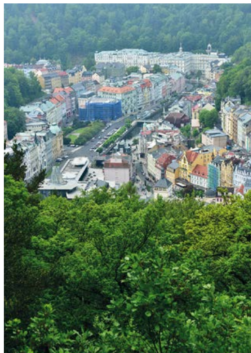
Pohled na Teplou a hlavní lázeňskou část Karlových Varů z vyhlídky Tři kříže