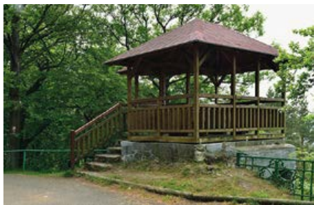
Altánek vyhlídky Tři kříže