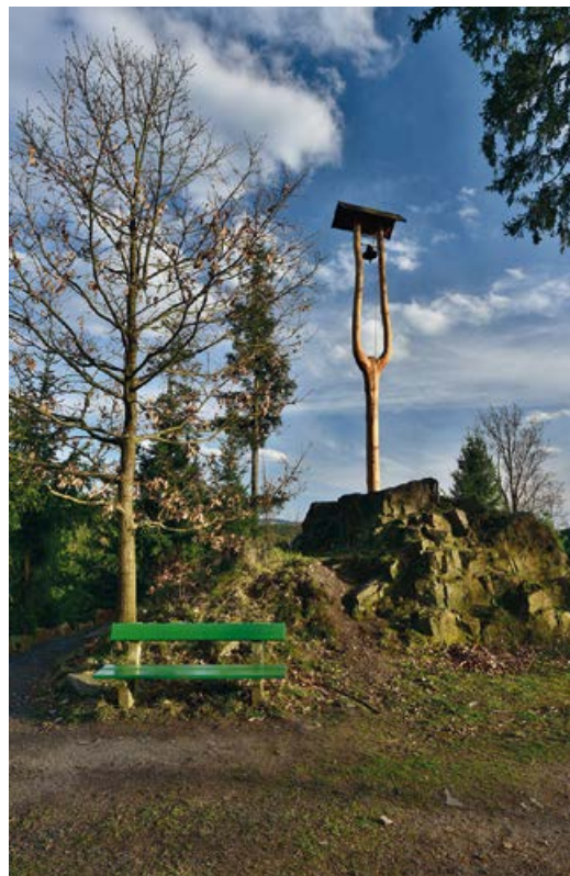
Zvonička Na Jungmance

Součástí je i stezka v korunách stromů s vyhlídkovými budkami. Nedílnou součástí lanového centra je pozorovatelna u Linharta, z níž je možné sledovat pasoucí se zvěř na přilehlém palouku. Vyhlídková plošina je ve výšce 4,3 m a je zastřešená.