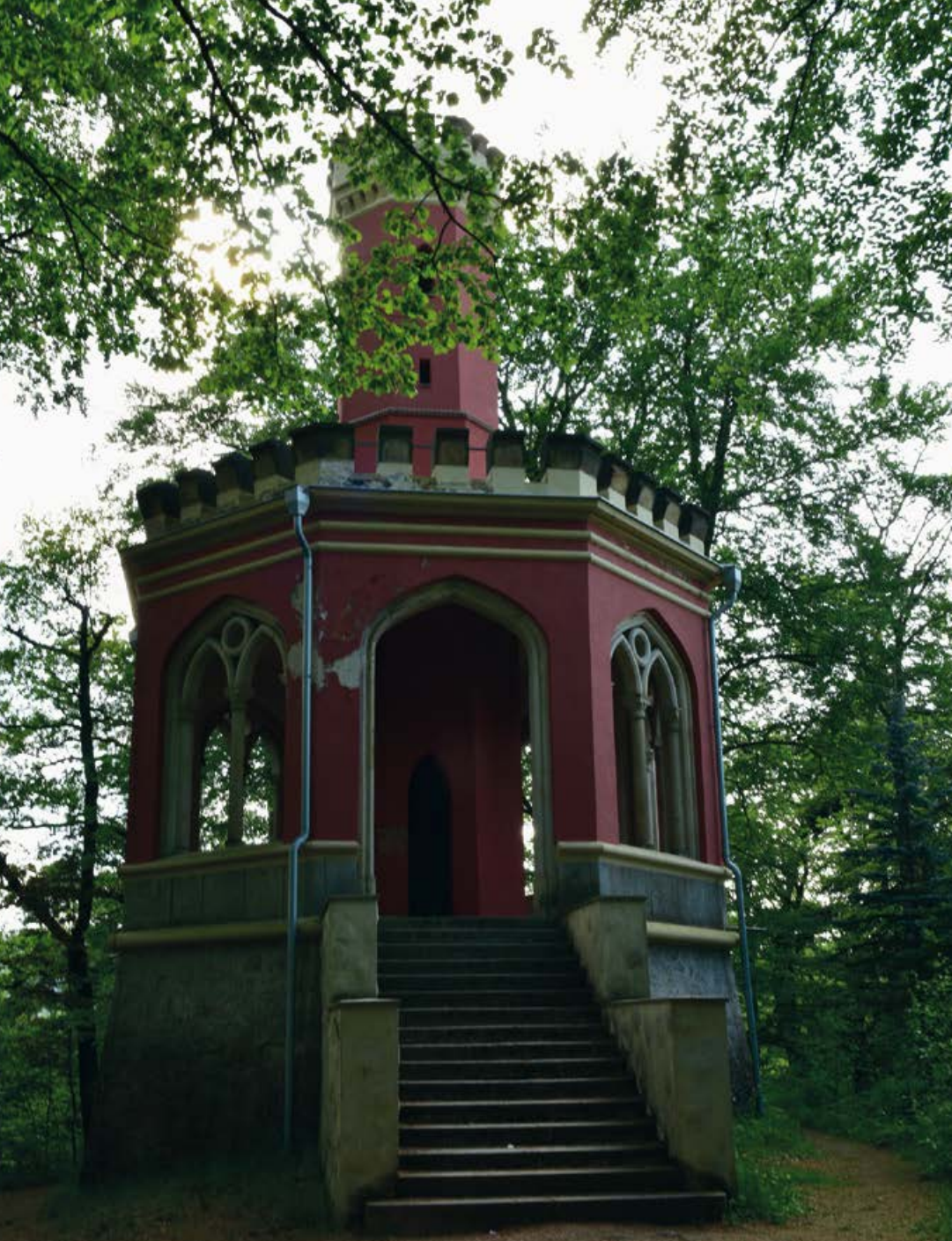
Věž vyhlídky Karla IV.