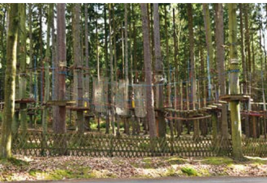
Část lanového centra Sv. Linhart

Součástí je i stezka v korunách stromů s vyhlídkovými budkami. Nedílnou součástí lanového centra je pozorovatelna u Linharta, z níž je možné sledovat pasoucí se zvěř na přilehlém palouku. Vyhlídková plošina je ve výšce 4,3 m a je zastřešená.