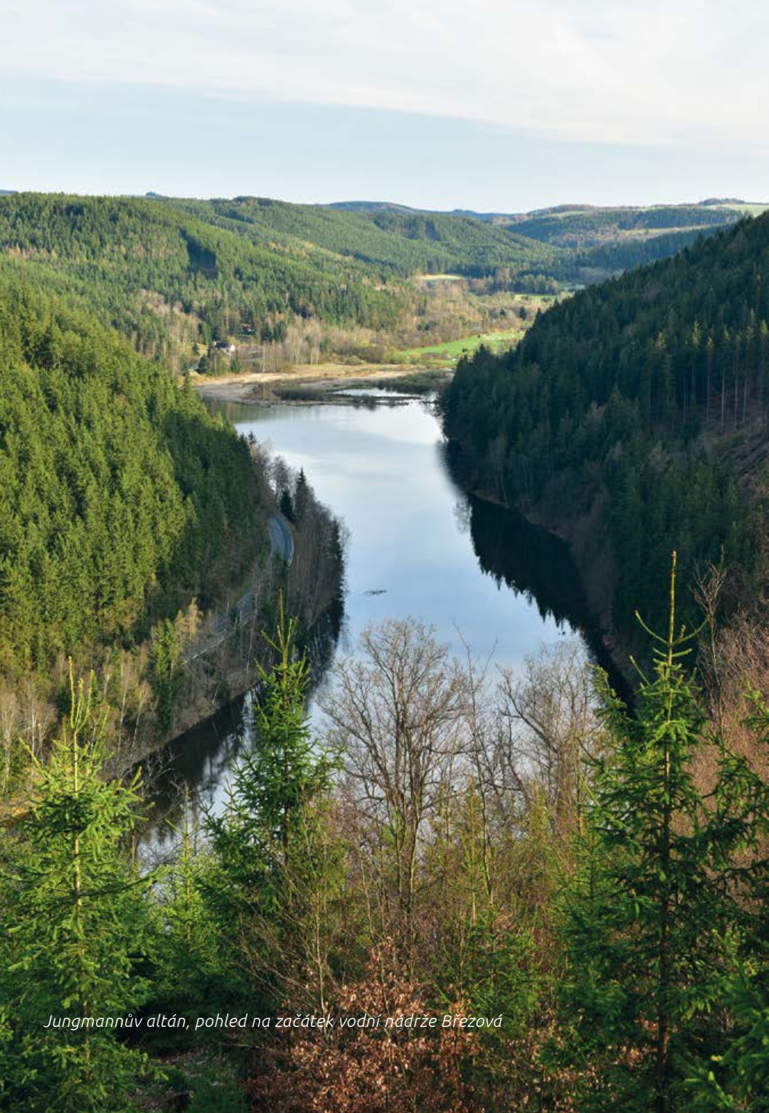
Jungmannův altán, pohled na začátek vodní nádrže Březová