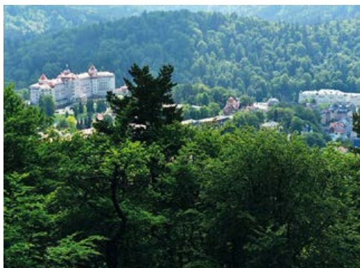
Pohled z vyhlídky Ottova výšina na hotel Imperial a Grandhotel Pupp