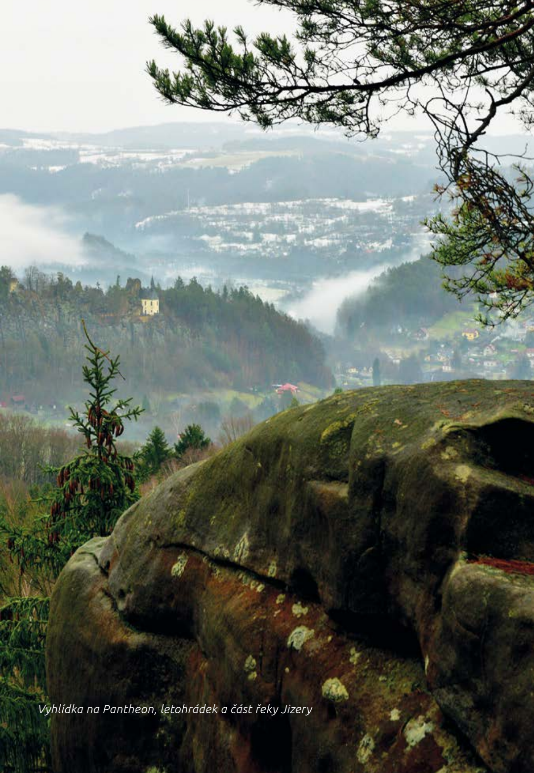
Vyhlídko na Pantheon, letohrádek a část řeky Jizery