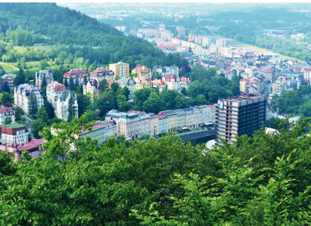
Centrum Karlových Varů a hotel Thermal z vyhlídky Camera obscura

Do Karlových Varů jezdí vlak z Prahy přes Ústí nad Labem nebo z Chebu. Z Prahy sem jezdí rovněž autobus. Hlavními příjezdovými silnicemi jsou dálnice D6, E442 nebo silnice I/6. Jelikož jsem do Varů přijel vlakem, začal jsem svoji cestu k vyhlídkám u muzea Jana Bechera, prošel jsem ulicí T. G. Masaryka a u Poštovního mostu jsem se napojil na zelenou turistickou trasu, která mě dovedla až na Rozcestí pod Třemi kříži. Odtud pak pokračuje ke všem třem vyhlídkám žlutá turistická trasa. Vyhlídky Camera obscura a Tři kříže nemůžete