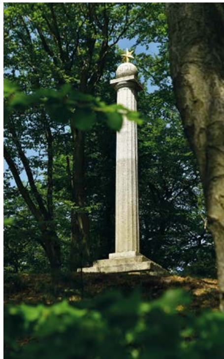
Ottův sloup na vyhlídce Ottova výšina