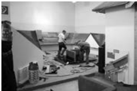
Obr. 1.002 Praktická část zkoušek izolačnicků

Dalším faktorem, který se u nás rozmáhá, jsou účelová jednorázová investiční „eseróčka“, založená na konkrétní investiční akci. Tyto firmy po ukončení akce, ale též před ukončením záruk zanikají a koneční majitelé nemovitosti nemají možnost záruky vymáhat. Účelem podobné společnosti je vydělat a zmizet.