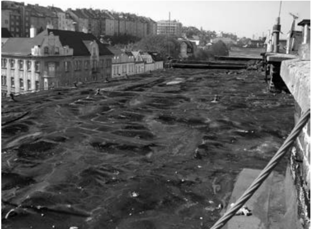
I toto je současný stav našich střešních pláštů