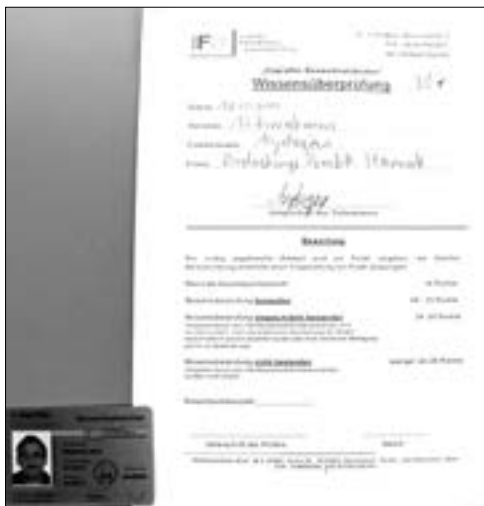
Obr. 1.001 Příklad zkušební formuláře a legitimace izolačnické firmy

Opět příklad ze života. Významný český generální dodavatel realizoval střešní plášť s obdobnou garážovou firmou, i když ve formě 200tisícového „eseróčka“. Tato firma rychle po realizaci zanikla a reinkarovala se pod jiným názvem. S předmětným střešním pláštěm byly dlouhodobé potíže, velmi časté reklamace, až po určité době zkolaboval hydroizolační materiál. Protože materiál dodávala ona garážová, již neexistující firma, musel celou rekonstrukci generální dodavatel provést na vlastní náklady. Celková cena rekonstrukce se vyšplhala na trojnásobek ceny původního střešního pláště. Nevím, jak dalece si generální dodavatelé uvědomují právní důsledky likvidace subdodavatele, ale čas od času k tomu dochází, a pak jsou samozřejmě záruky za stavební dílo nebo jeho část prakticky nevymahatelné.