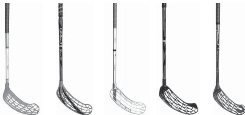
Obr. 1 Florbalové hole

Jedním z hlavních kritérií pro výběr hole je její tvrdost a délka. Optimální délku hole zjistíme tak, že ji postavíme čepelí na zem – její horní konec by měl sahat do oblasti břicha. Délka hole se pohybuje v rozmezí 70–100 cm. Její tvrdost by měla být vybírána v závislosti na fyzických dispozicích a stylu hry hráče. Tvrdost se pohybuje v rozmezí 23–32 mm a je na holi vyznačena (23 mm je průhyb zatížení tyče, tudíž největší povolená tvrdost, 32 mm, je nejměkčí). Čím větší je síla hráče, tím se doporučuje tvrdší hůl. Nicméně výběr hole je individuální i vzhledem ke stylu hry. Všechny světové značky nabízejí široký výběr holí všech tvrdostí lišících se v technologii výroby, materiálu a váze.