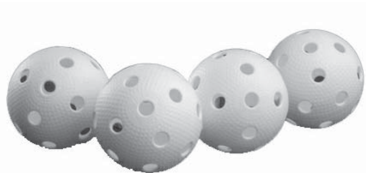
Obr. 2 Florbalové míčky