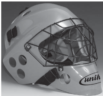
Obr. 3 Maska brankáře