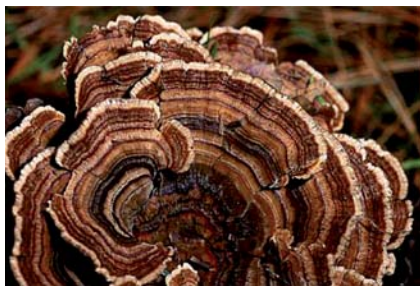
Obr. 10 Outek pestrá

Vrchní strana je sametová s bílým až okrovým ztenčeným okrajem, později černým.