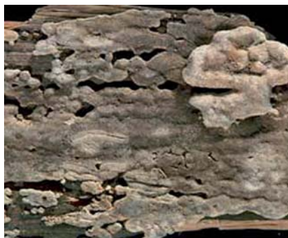
Obr. 8 Pórnatka placentová

až zelenohnědá. Nevytváří silné a dlouhé provazce jako dřevomorka domácí. Při svém růstu vylučuje do prostředí kyseliny, které vytváří vhodné podmínky pro růst dřevomorky domácí, proto se mohou tyto dvě houby vyskytovat současně. Tato houba je používána při zkoušce preventivní účinnosti proti dřevokazným houbám ČSN EN 113 ve třídě ohrožení 1, 2, 3.