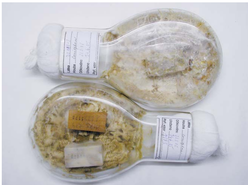
Obr. 2 Zkouška podle ČSN EN 113 preventivní účinnosti proti dřevokazným houbám Basidiomycetes