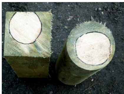
Obr. 1 Tlaková impregnace

Na základě údajů v tabulce 2 můžeme říci, že odolnost našich dřevin proti dřevokazným houbám není příliš velká, pouze dub je klasifikován jako trvanlivý, ostatní dřeviny jsou středně nebo slabě trvanlivé. Trvanlivost se týká pouze jádrového dřeva, bělové dřevo se většinou považuje za netrvanlivé. Vzhledem k těmto skutečnostem je tedy nutné chránit dřevo před působením dřevokazných hub takovým způsobem, aby pro ně nebyly vytvořeny vhodné podmínky, tj. vlhkost a teplota. Pokud toto nemůžeme zabezpečit, je vhodnější se použití dřeva pro dané účely vyhnout. Ovšem ani tlaková impregnace nám nezajistí dokonalou ochranu v celém průřezu materiálu. Jednotlivé dřeviny lze proimpregnovat úspěšně pouze v bělové zóně, takže nejlepší pro tento typ ochrany jsou prvky s kruhovým průřezem. Pokud se budeme snažit tlakově naimpregnovat trám čtvercové-