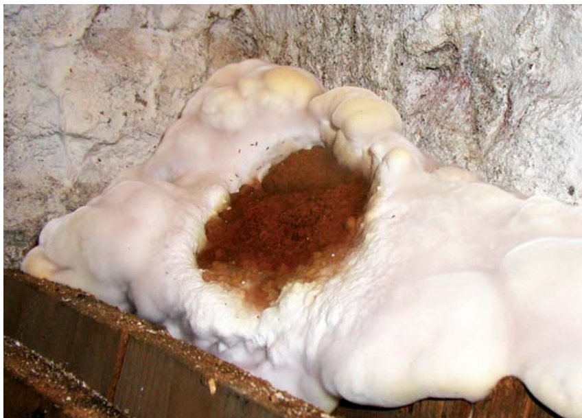
Obr. 3 Plodnice dřevomorky

Dřevomorka prorůstá různými lignocelulózovými materiály, ale také zdivem, maltou atd. Plodnice je na okraji bílo-žlutá, ke středu oranžová, až oranžovo-hnědá až hnědo-rezavá. Na větší vzdálenost (i několika metrů) se rozrůstá pomocí provazců – rhizomorf.