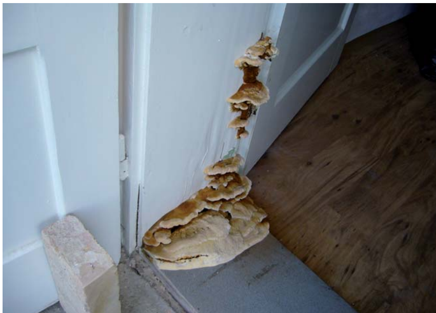
Obr. 6 Dřevomorka v dřevěné zárubni