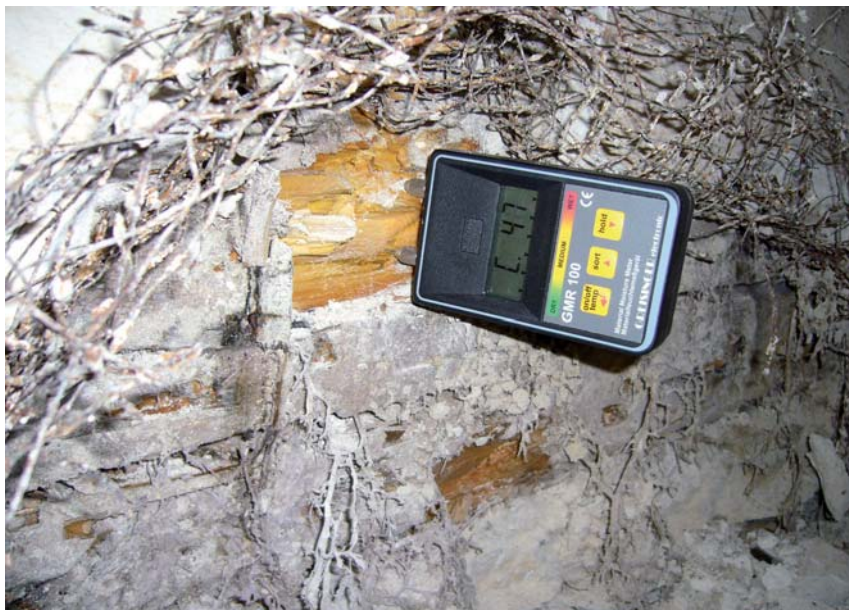
Obr. 4 Rhizomorfy dřevomorky ( www.spuni.cz )

Dřevo napadené dřevomorkou je nutné mechanicky odstranit, vložit do vhodných pytlů a uložit na skládku nebo spálit (pozor na možnost úletu výtrusů). Je nutné opatrně odstranit veškeré napadené části, jakékoliv „zbytky“ mohou přežít a několik let a při vytvoření vhodných podmínek může houba opět začít vyvíjet aktivitu. Potřebné je odstranit i celé násypy, podlahy, omítku atd., nevyhnutelné je odstranit i dřevo zdánlivě zdravé min. 0,5 m od viditelného napadení (nejlépe 1–1,5 m). Při masivním napadení je vhodné nechat si provést posudek stavu konstrukce a návrh sanace, samotnou sanaci mohou provést i specializované firmy.