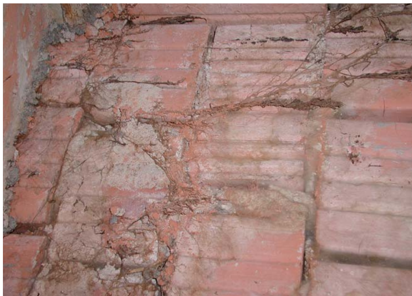
Obr. 5 Rhizomorfy dřevomorky

chráněná), je nutné vytvořit takové podmínky, které zabrání opětovnému růstu. Jde zejména o snížení vlhkosti a časté větrání stavby, pokud je to potřeba tak i nuceně (ventilátory).