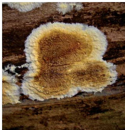
Obr. 7 Koniofora sklepní

Dřevo pokrývá tenkým nepravidelným povlakem, okraj plodnice je bílý, směrem do středu barva žlutookrová