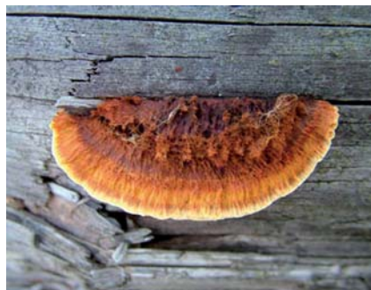
Obr. 9 Trámovka plotní

Ke svému růstu potřebuje vlhkost dřeva 35–40 %, roste při teplotách 5 až 45 °C, nejintenzivněji při teplotě 31 °C. Napadá dřevo jehličnatých dřevin, upřednostňuje smrk a borovici, výjimečně napadá i dřevo listnatých dřevin. Rozkládá dřevo „zevnitř“, napadený trám je zvenku na první pohled na povrchu neporušený a pevný, dřevo je kostkovitě rozpadlé uvnitř.