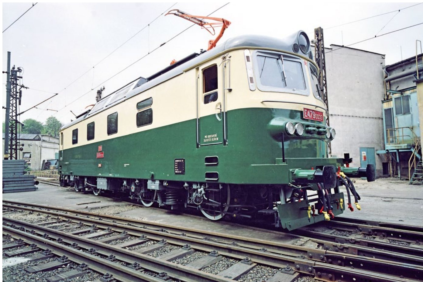
▲ Zbrusu nová lokomotiva E 479.0033 při najždění svých prvních metrů vlastní silou po zkušební koleji výrobního závodu.