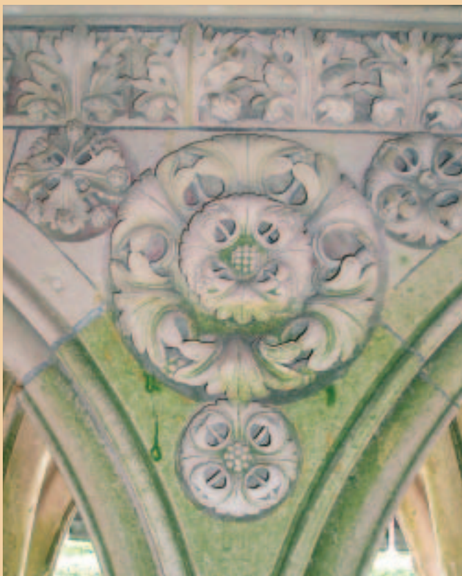
Gotická klášterní výzdoba, Mont Sant Michel, Francie

Zatímco baroko si potrpělo na duchovní hloubku