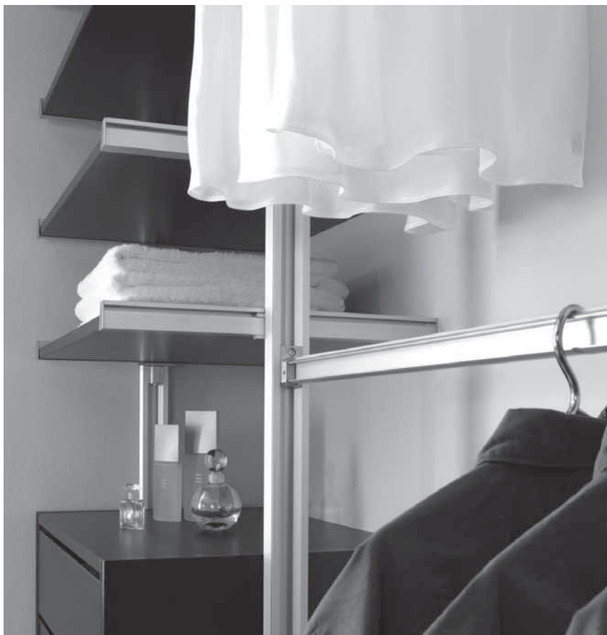
Obr. 7 Šatní systémy

Nedílnou součástí každé skříně a skříňky jsou madla a úchytky. Moderní jsou jednoduchá tyčová v různých délkách, na posuvné dveře se používají vystouplé