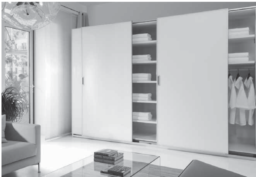
Obr. 6 Objem úložných prostor vždy plánujeme s rezervou

Trendem posledních let jsou podlouhlé formáty členění skříněk. Preferují se široké obdélníkové kontejnery a výklopné skříně. Tento trend je viditelný na komodách, televizních stolcích i velkých skříních. Často se můžeme setkat s členěním vestavných skříní do podlouhlých formátů, mnohdy se jedná pouze o pohledové členění, které se samostatně neotevívá.