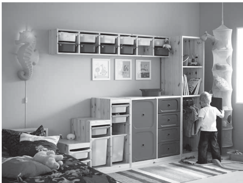
Obr. 8 Systematické uspořádání prostor v dětském pokoji učí dítě pořádku ve svých věcech