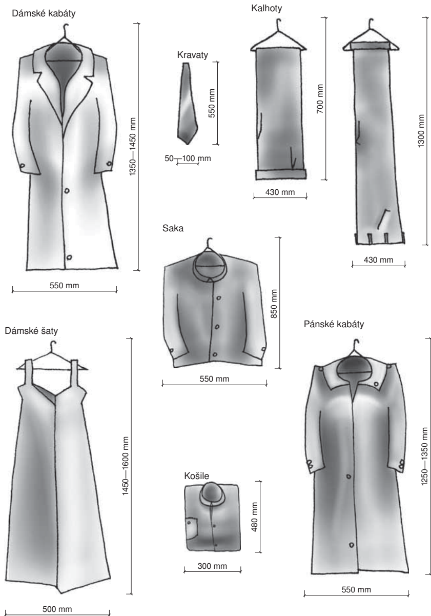
Obr. 5b Obvyklé rozměry nepoužívanějšího oblečení