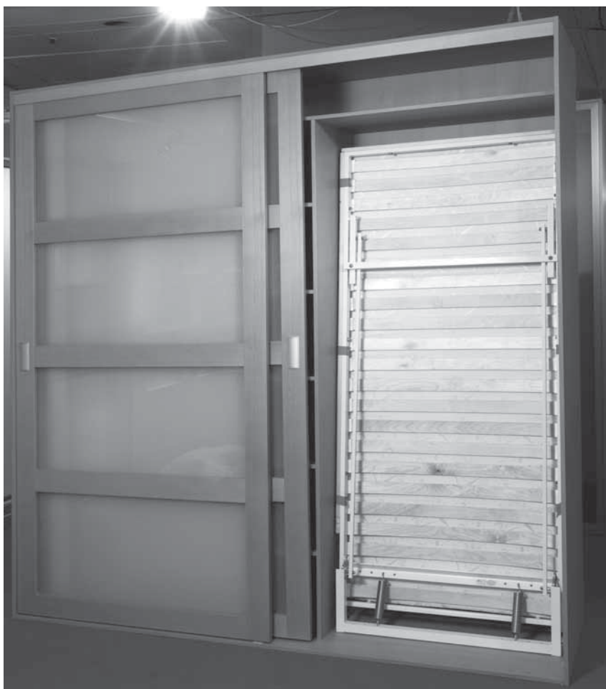
Obr. 2 Za posuvné dveře lze uschovat sklopnou postel nebo malou pracovní

Před tím, než se pustíme do zařizování interiéru, musíme si uvědomit, jaké jsou naše požadavky na úložné prostory. Nezapomeňme, že další prostor nám zaberou sezónní potřeby nebo sportovní vybavení. Nenechme se zcela strhnout trendy, kde se minimalizuje umístění nábytku v interiéru – objem úložných prostor je zde přemístěný z obytné části zpravidla do vestavěných skříní a šatěn. V úvahu