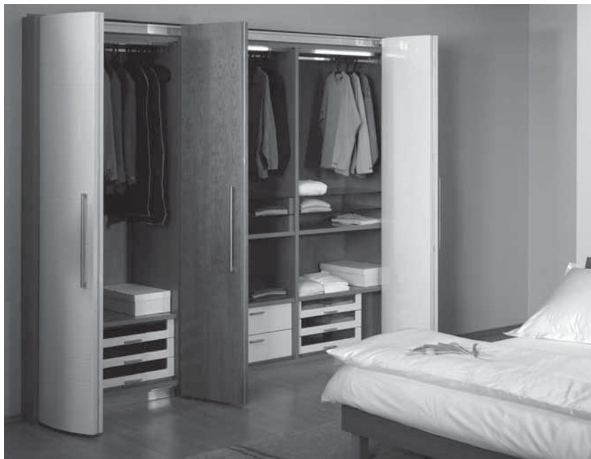
Obr. 3 Odstín vanilkové s třešňovou dýhou je elegantní kombinací

vždy berme velikost našeho bytu. Nevycházejme pouze z kvantitativní potřeby současnosti, vždy počítejme s tím, že některé věci přikoupíme a úložný prostor by měl mít rezervu.