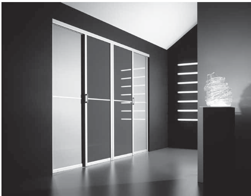
Obr. 1 Kompaktní vestavěná skříň působí v interiéru přirozeně

Během života nashromáždíme velké množství věcí. Neustále dokupujeme nové kusy oblečení, zařizovacích předmětů, hobby potřeb, knih apod. Většina z nás věci hromadí i pro případ, že by se ještě mohly hodit, a proto nic nevyhodí. Místo, abychom věci obměňovali, setkávají se nám mnohdy předměty s letitou patinou s těmi nově koupenými. Nezdívka kdy si koupíme i to, co vlastně vůbec nepotřebujeme. Často ukládáme věci, ke kterým máme citový vztah – hračky z dětství, nádobí po babičce, drobnosti z cest aj. Samostatnou kapitolou jsou dárky, které jsou mnohdy nevhodné, ale z úcty k dárci je pečlivě uschováme.