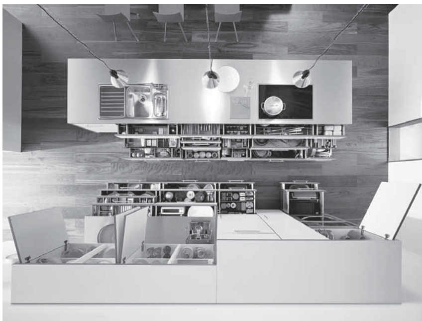
Obr. 4 Ergonomicky řešené úložné prostory v kuchyni