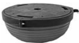
obrácená balanční polokoule