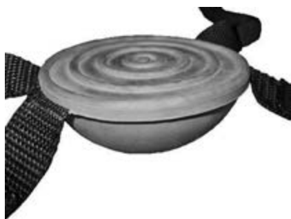
malá balanční polokoule (detail)

Jedná se o dvě malé pryžové polokoule, připevňované pomocí pásek na suché zipy ke cvičební obuvi. Balance step (v angloamerické literatuře i pod pojmem Balance paws) je jednoduchá balanční pomůcka, která působí komplexně na harmonickou činnost svalstva celého organismu. Pomáhá rozvíjet pohybové dovednosti, cit pro rovnováhu, reakční schopnost, svalovou sílu a pohybovou koordinaci. Předností je malá velikost, skladnost, nízká hmotnost, nezávislost na velikosti obuvi.