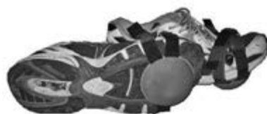
uchycení na obuvi pro tréninkové využití

Pro tréninkové využití je typické umístění balančních polokoulí v přední polovině obuvi. Čím blíže ke špičce boty, tím je cvik účinnější a náročnější. Posuneme-li polokoule do centra podélné osy chodidla, získáme balanční prostředek, který má preventivní a léčebný účinek na hluboké zádové svaly kolem páteře a na hlezenní i kolenní kloub.