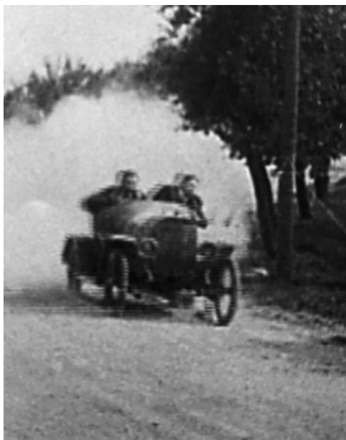
V zatáčce u Třemošenského rybníka se jelo v blízkosti sloupků i stromů opravdu naplno (1914)

Ale zpět do začátků závodu do vrchu v Lochotíně. Plzeň byla uspořádáním závodu nadšena, ač to bylo ještě za vlády císaře Františka Josefa I. Obecnostvo vidělo ve městě věčné ceny vystavené v honosné budově Anglosaské banky v dnešní Smetanově (Fodermayerově) ulici, a potom se museli vydat relativně daleko za město. Původně se mělo závodit už 11. června 1914 v 15 hodin, ale hodinu před závodem prudký déšť změnil trať k nepoznání a start musel být zrušen. Přihlášeno bylo 25 startujících, z toho 6 motocyklů a 1 tříkolka, dále 1 cyclecar, 15 automobilů cestovních a 2 závodní.