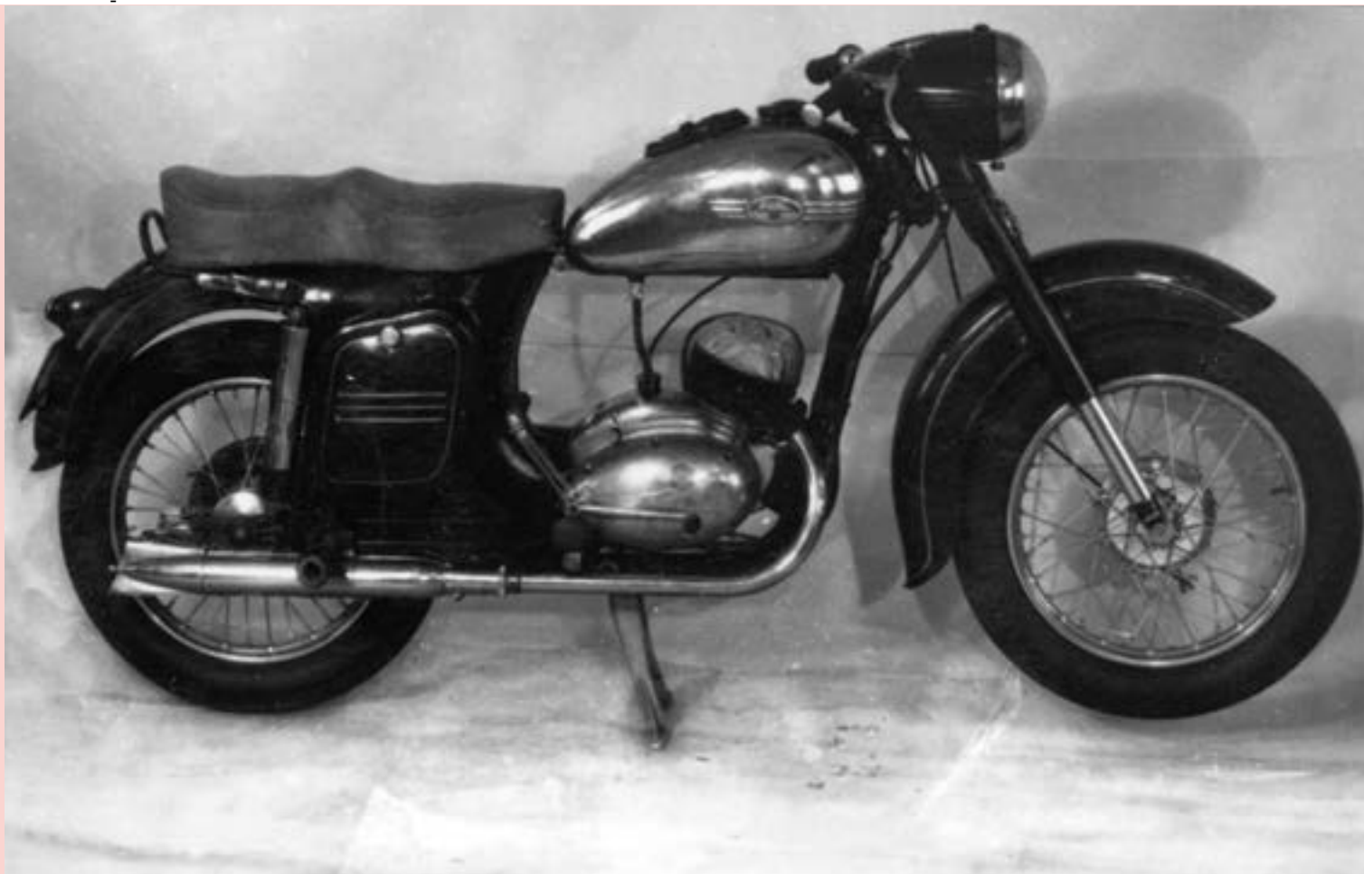
▲► Jawa-ČZ 150, prototyp mezitypové jednotné (národní) řady, oboustranný pohled