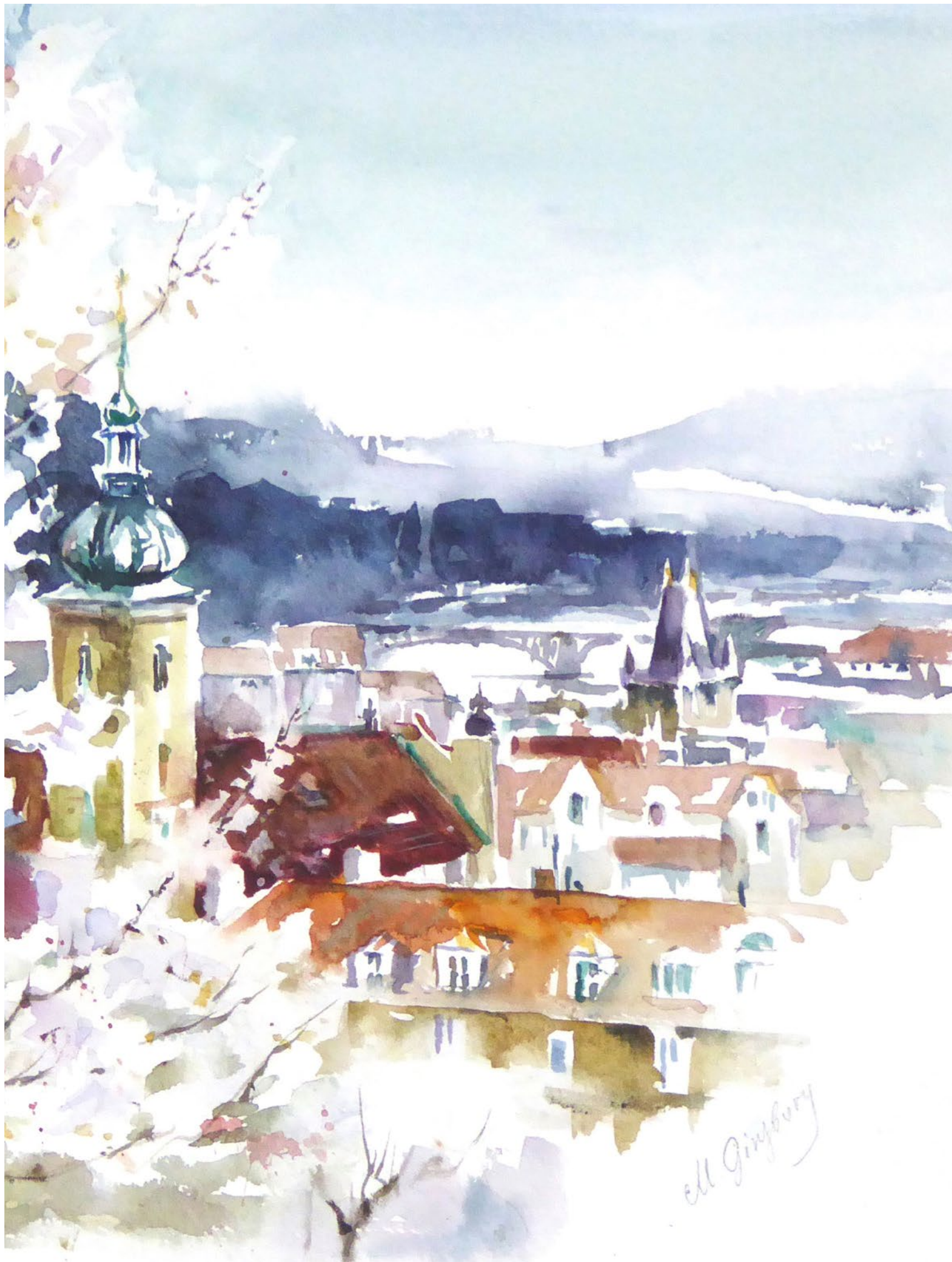
Střechy s kostelem „U Pražského Jezulátka“ Roofs with the Church „Infant Jesus of Prague“