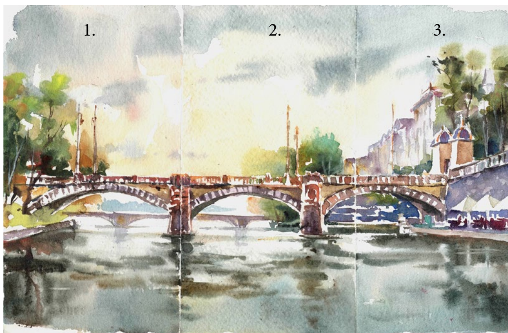
Most Legií, pohled z Campy Legion Bridge, view from Campa

Některé firmy jako Fabriano a Arches vyrábějí také extra bílý papír.