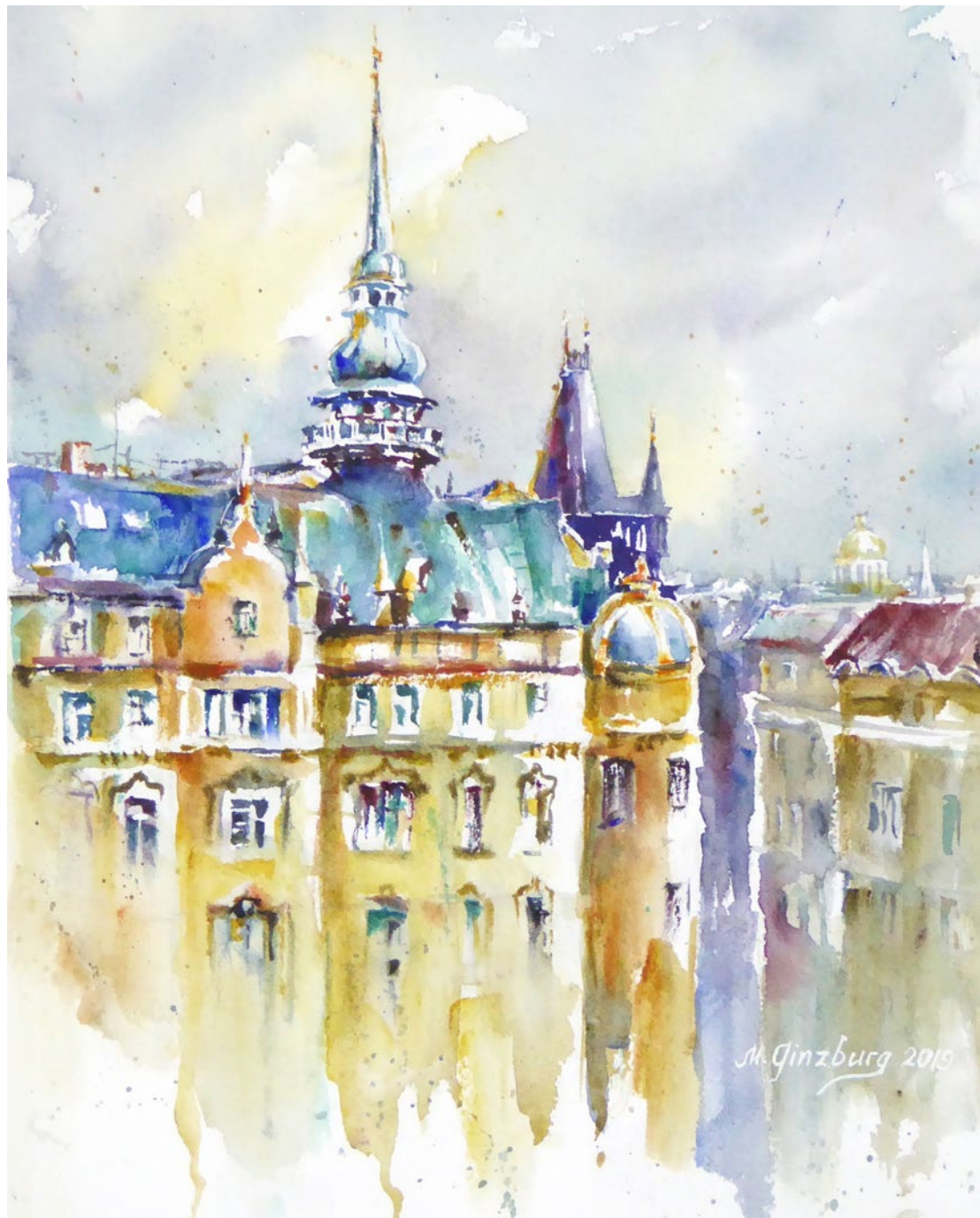
Pohled z terasy obchodního domu Kotva (Arches 300 g, jemný) A view from the terrace of Kotva Department Store, (Arches 300 g fine)

If you want to layer the colours to get depth and shine, I recommend using Arches paper, but washing off watercolour paints from this paper is very difficult.