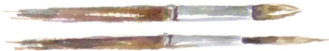
Štětce Kolínského Kolinsky brushes

Je třeba vzít na vědomí, že číslování velikostí štětců se u různých výrobců liší.