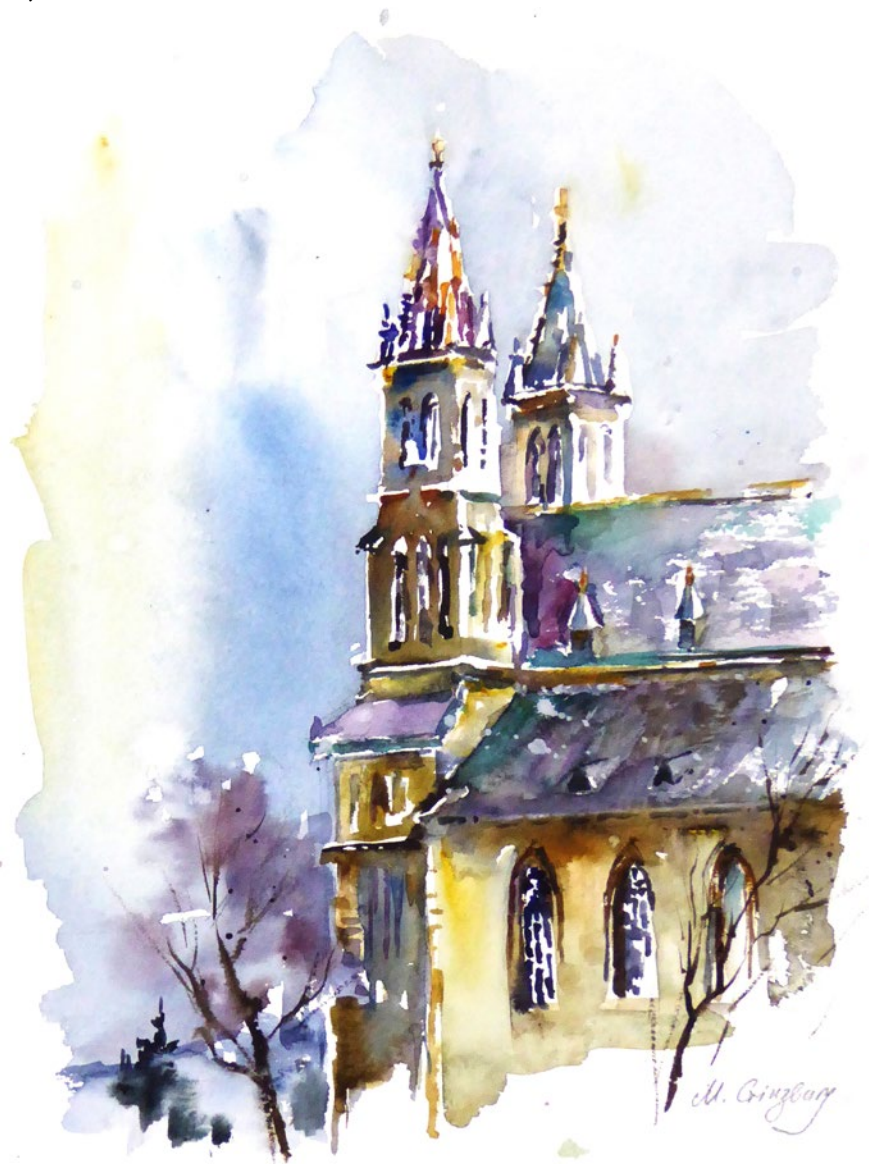
Bazilika svatého Petra a Pavla, Vyšehrad (Fabriano 300 g, jemný) Basilica of St. Peter and Paul, Vyšehrad (Fabriano 300 g, fine)

Pokud chcete barvy vrstvit, abyste získali hloubku a lesk, doporučuji použít papír Arches , ale smývání akvarelových barev z tohoto papíru je už složité.